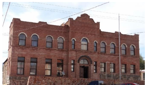
La Cárcel de Cananea (e. 1903)

Farewells I didn't give Because I don't bring it here I left it to the Child And to Saint Señor Mapimí